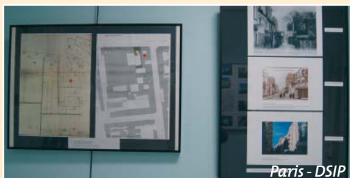
Paris - DSIP