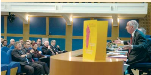
Jean Tulard, membre de l'Institut, lors de son intervention du 9 novembre.