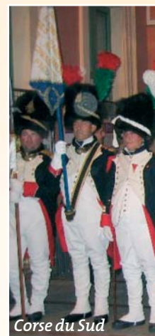
Corse du Sud