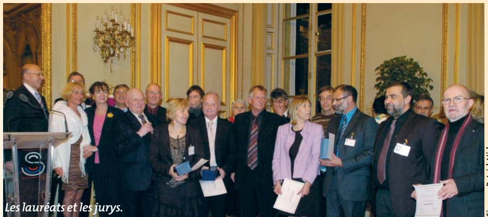
Les lauréats et les jurys.

Par ailleurs, un trophée et un diplôme seront décernés aux accessits des trois séries dans leurs directions respectives. Tous les participants du concours ont reçu un message de remerciements du directeur général.